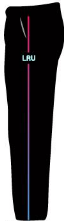
ด้านข้าง