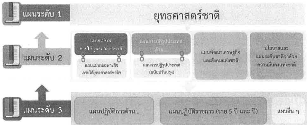
แผนภาพที่ 1-1 ภาพรวมความเชื่อมโยงของแผน 3 ระดับ

มติคณะรัฐมนตรี วันที่ 4 ธันวาคม พ.ศ. 2560 เห็นชอบการจำแนกแผนออกเป็น 3 ระดับ ประกอบด้วย แผนระดับ 1 ยุทธศาสตร์ชาติ แผนระดับ 2 ประกอบด้วย แผนแม่บทภายใต้ยุทธศาสตร์ชาติ แผนการปฏิรูปประเทศ แผนพัฒนาเศรษฐกิจและสังคมแห่งชาติ นโยบายและแผนระดับชาติว่าด้วยความมั่นคงแห่งชาติ และแผนระดับ 3 เป็นแผนที่จัดทำขึ้นเพื่อสนับสนุนการดำเนินงานของแผนระดับที่ 1 และแผนระดับที่ 2 สู่การปฏิบัติให้บรรลุเป้าหมายที่กำหนดไว้ หรือจัดทำขึ้นตามกฎหมายที่กำหนด หรือจัดทำขึ้นตามพันธกรณีหรืออนุสัญญาระหว่างประเทศ ทั้งนี้แผนระดับที่ 3 หมายรวมถึงแผนปฏิบัติการทุกระดับ ตามแผนความเชื่อมโยงดังแผนภาพที่ 1-1